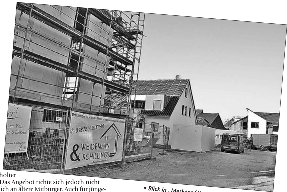
• Blick in „Meskens Stiege“.

der Bocholter HeimBau. Das Angebot richte sich jedoch nicht ausschließlich an ältere Mitbürger. Auch für jüngere Menschen seien die Wohnungen durchaus attraktiv.