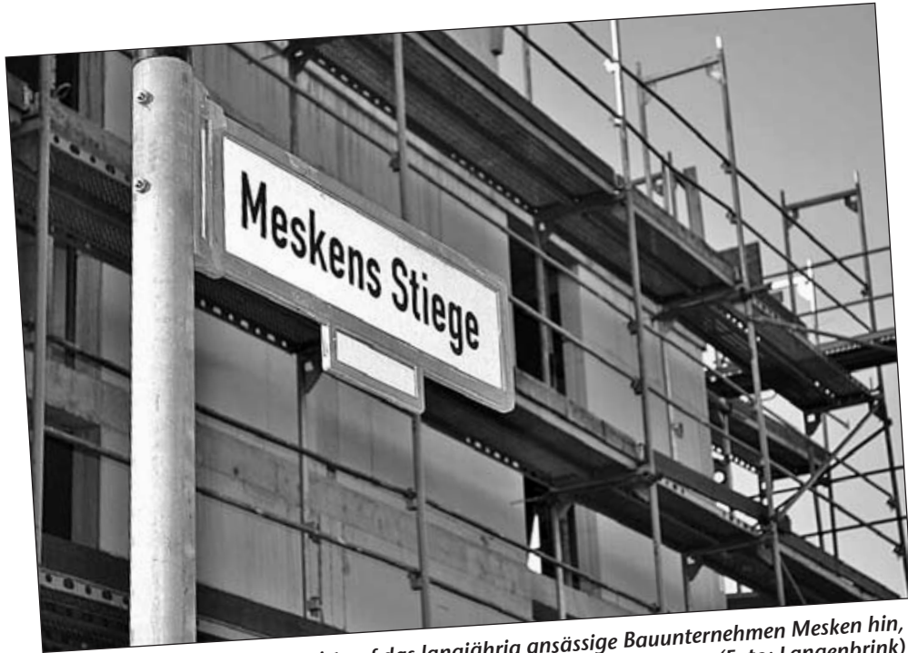
• Das neue Straßenschild weist auf das langjährig ansässige Bauunternehmen Mesken hin, welches nun seinen Sitz im iPark hat.

stuhl oder die elektrischen Rollläden. In Sachen Energie sind die Bewohner unabhängig von Öl- oder Gaspreisen. Das geschieht durch die ökologisch regenerative Heizungsanlage, die dem hohen energetischen Standard „KfW Energiehaus 70“ entspricht. Nicht zuletzt macht auch die Lage das Objekt interessant. Etwa 500 Meter sind es bis zur Innenstadt Bocholts. Somit fallen in Sachen Einkauf, Kultur, Gastronomie oder Arztbesuche keine langen Wege an.