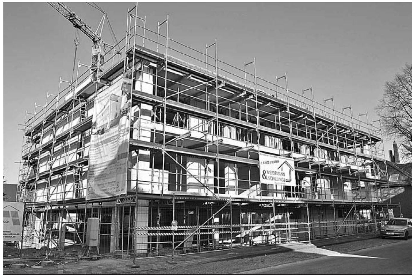
• Neubau an der Ecke Kurfürstenstraße / Meskens Stiege.