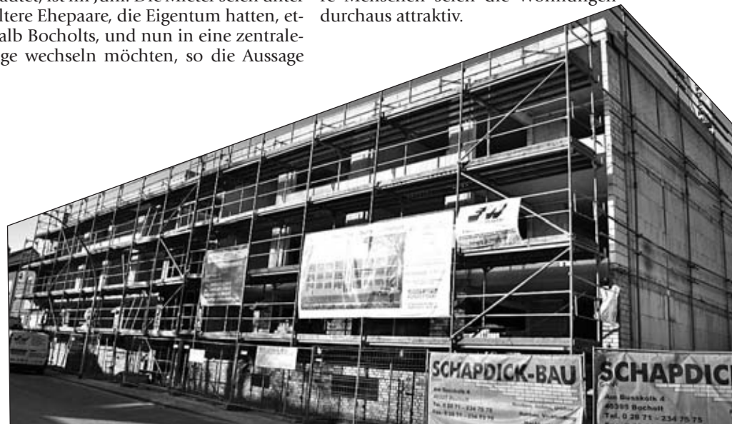
• 17 Stadtmietwohnung entstehen an der Hohenzollernstraße, Höhe Salierstraße.

www.bocholter-report.de klicken Sie doch mal rein